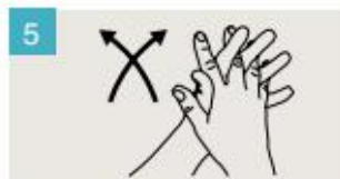
Frótese las palmas de las manos entre sí, con los dedos entrelazados.