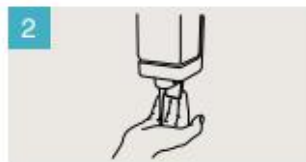
Aplique suficiente jabón para cubrir todas las superficies de las manos.