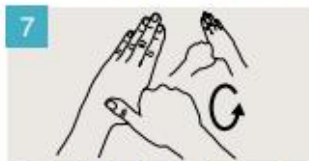
Rodeando el pulgar izquierdo con la palma de la mano derecha, fróteselo con un movimiento de rotación, y viceversa.