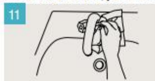
Utilice la toalla para cerrar el grifo.