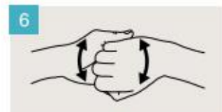
Frótese el dorso de los dedos de una mano contra la palma de la mano opuesta, manteniendo unidos los dedos.