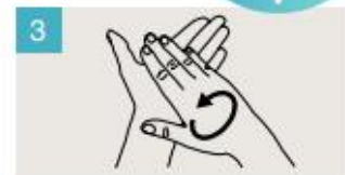
Frótese las palmas de las manos entre sí.