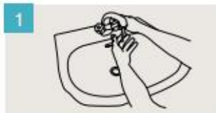
Mójese las manos.

DURACIÓN DEL LAVADO: entre 40/60 segundos