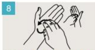
Frótese la punta de los dedos de la mano derecha contra la palma de la mano izquierda, haciendo un movimiento de rotación, y viceversa.